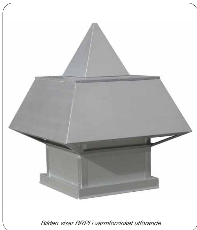
Bilden visar BRPI i varmförzinkat utförande