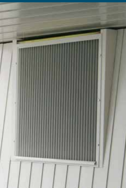
Turning Torso är ett exempel på projekt dit BRYV levererats